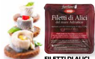
3.56€ 23,73 € al kg FILETTI DI ALICI DEL MARE ADRIATICO FIOR FIORE COOP marinati con olio extra vergine di oliva, profumo di limone, 150 g