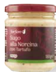
3.19€ 17,72 € al kg SUGO ALLA NORCINA CON TARTUFO FIOR FIORE COOP 180 g