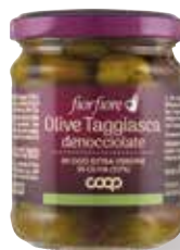
4.50€ 25,00 € al kg OLIVE TAGGIASCHE DENOCCIOLATE FIOR FIORE COOP 180 g