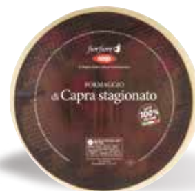
2.75€ all'etto FORMAGGIO DI CAPRA FIOR FIORE COOP stagionato, latte 100% italiano, al taglio