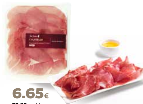
6.65€ 73,89 € al kg CULATELLO FIOR FIORE COOP stagionatura minima 12 mesi, da suini 100% italiani, 90 g