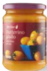
2.26€ 10,76 € al kg POMODORI DATTERINI GIALLI FIOR FIORE COOP interi, datterino giallo della piana del sele 350 g