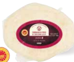
2.89€ all'etto FORMAGGIO DI FOSSA DI SOGLIANO DOP FIOR FIORE COOP latte di pecora, al taglio