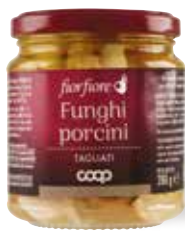
9.15€ 32,68 € al kg FUNGHI PORCINI TAGLIATI FIOR FIORE COOP 280 g