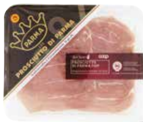
5.69€ 56,90 € al kg PROSCIUTTO DI PARMA DOP FIOR FIORE COOP stagionatura minima 24 mesi, 100 g