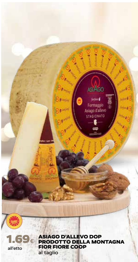
1.69€ all'etto ASIAGO D'ALLEVO DOP PRODOTTO DELLA MONTAGNA FIOR FIORE COOP al taglio