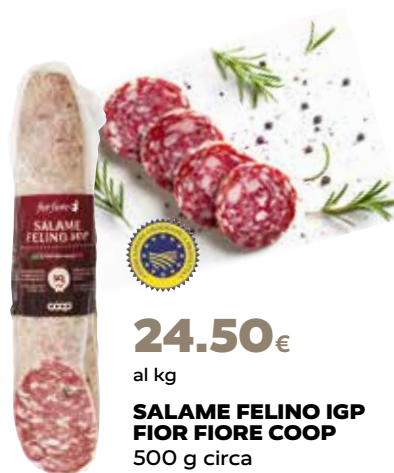
24.50€ al kg SALAME FELINO IGP FIOR FIORE COOP 500 g circa